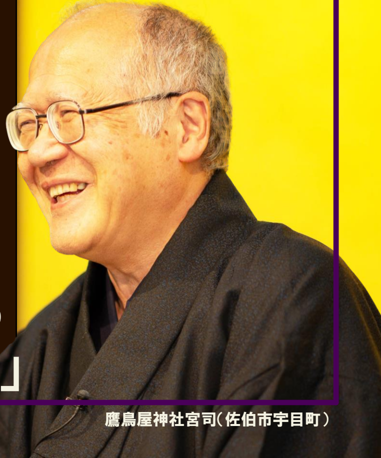
鷹鳥屋神社宮司(佐伯市宇目町)